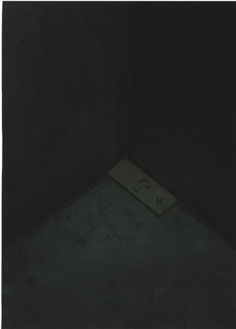
Bei der Grundsteinlegung werden in jeder Ecke des Fundaments Steinplatten gelegt.