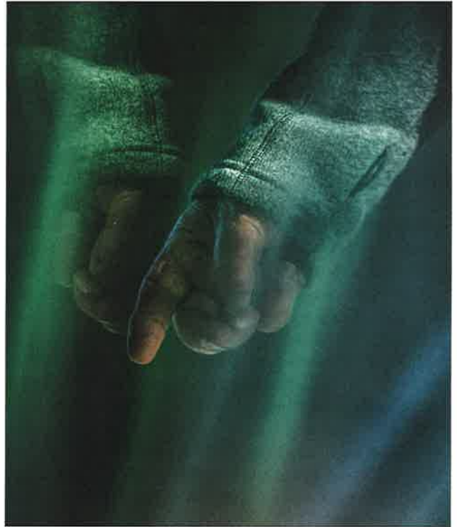
Körperspannung: Die Radiästhesie ist eine mentale Angelegenheit.