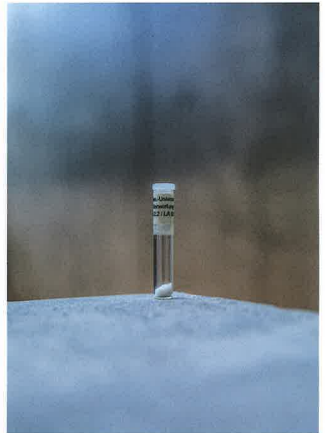
Homöopathische Mittel sollen gegen Elektromog wirken.

«Wir bauen heute gesund», stellt der Bauökologe klar. «Die akuten Gefahren sind vom Tisch.» Asbest wird nicht mehr verwendet, giftige Lösungsmittel sind verboten. Dass sich Menschen trotzdem unwohl fühlen, hat einerseits mit dem Wohlstand zu tun, den die Aufklärung geschaffen hat. Erst wer Heizung, Licht und Storen im Haus per Knopfdruck bedient, macht sich Sorgen um pseudowissenschaftliche Theorien. Andererseits geht es um Sinnuche. Die einen sehnen sich nach etwas Urtümlichem als Antwort auf die Technik, die unser Leben und unsere Ge-