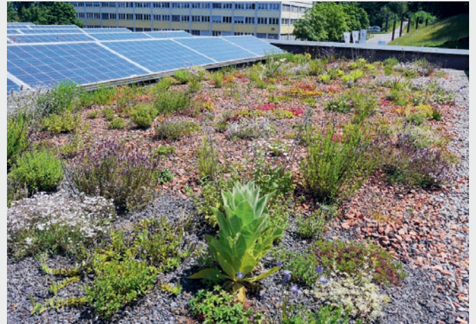
Fig. 2 Begrünte Dächer und Fassaden speichern einen Grossteil des Niederschlags, reduzieren durch die Evapotranspiration die Oberflächentemperatur und fördern die Artenvielfalt.

unseren Siedlungen, damit die Gefahren durch den Klimawandel abgemildert werden: Wasser muss in die Gestaltung von Siedlungen und deren Infrastrukturen integriert, zurückgehalten, verdunstet, gefahrlos abgeleitet und als Gestaltungselement genutzt werden. Dieses «klimaangepasste Wassermanagement» bietet Chancen für Mensch und Natur gleichermaßen.