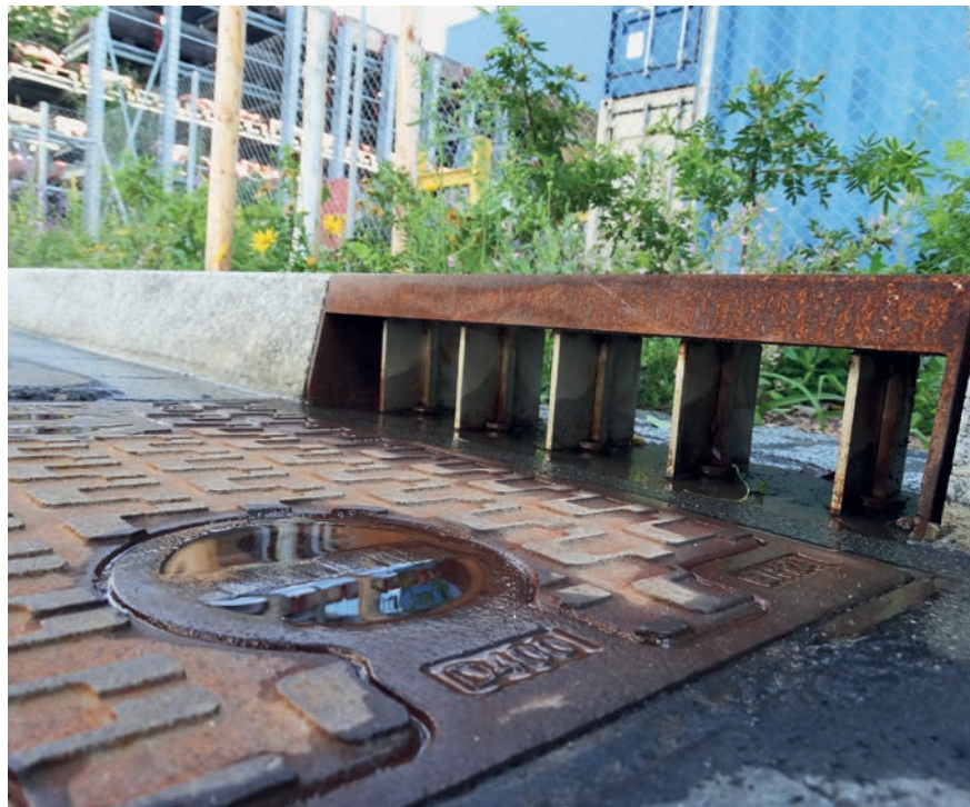
Giessereistrasse in Zürich: Das Regenwasser fliesst nur noch während der Wintermonate, in denen Streusalz zum Einsatz kommt, in die Kanalisation. In der restlichen Zeit wird das Regenwasser in den Vegetationsbereich umgeleitet, wo es langsamer abfließt und über die Bäume verdunsten kann (Schlammsammler geschlossen, Randstein geöffnet).

Im Projekt wird das «einbeziehen aller Ansprechgruppen» als Erfolgsfaktor betont. Es braucht folglich mehr als nur reines Expertenwissen in der Projektorganisation. Hat der VSA als Wasser-