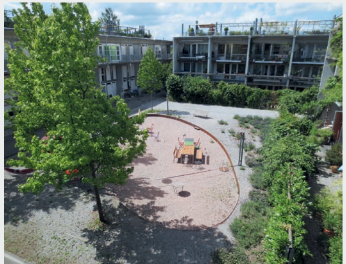
Fig. 4 Natürlich gestalteter Spielplatz im Siedlungsgebiet.