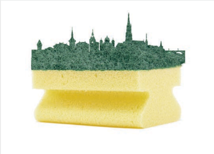
Fig. 1 Schwammstädte saugen Regenwasser auf wie ein Schwamm.