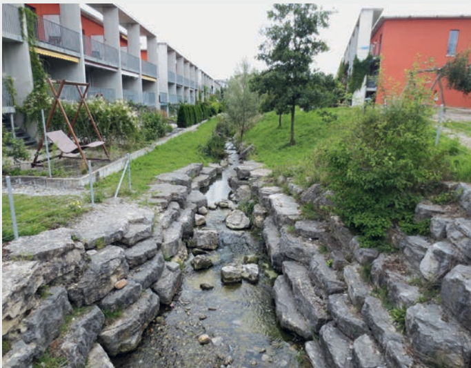
Fig. 3 Naturnah ausgestaltete Bäche statt eingedolte Bäche im Siedlungsgebiet erfüllen zahlreiche Funktionen.