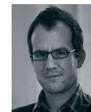
Christian Jauslin Kommunikation