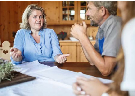
Landwirt beim Coaching.

Auch zeigt die Studie, dass weder lange Arbeitstage noch der Verzicht auf Ferien in Verbindung mit erhöhtem Auftreten von Burnout-Symptomen gebracht werden können. Es scheint, als hätte dies im landwirtschaftlichen Arbeitskontext keinen wesentlichen Einfluss auf das psychische Wohlbefinden. Auch Nebenerwerbstätigkeiten scheinen bei nicht zu hohen Pensen eher als guter Ausgleich, denn als psychische Belastung wahrgenommen zu werden. Jedoch lassen die Resultate der Studie vermuten, dass eine 7-Tage-Arbeitswoche,