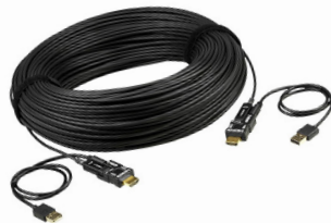
Optical HDMI Cable with external Powersource Quelle: ATEN (aten.com)