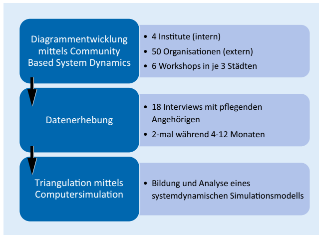
Abb. 1 ◀ Methodik