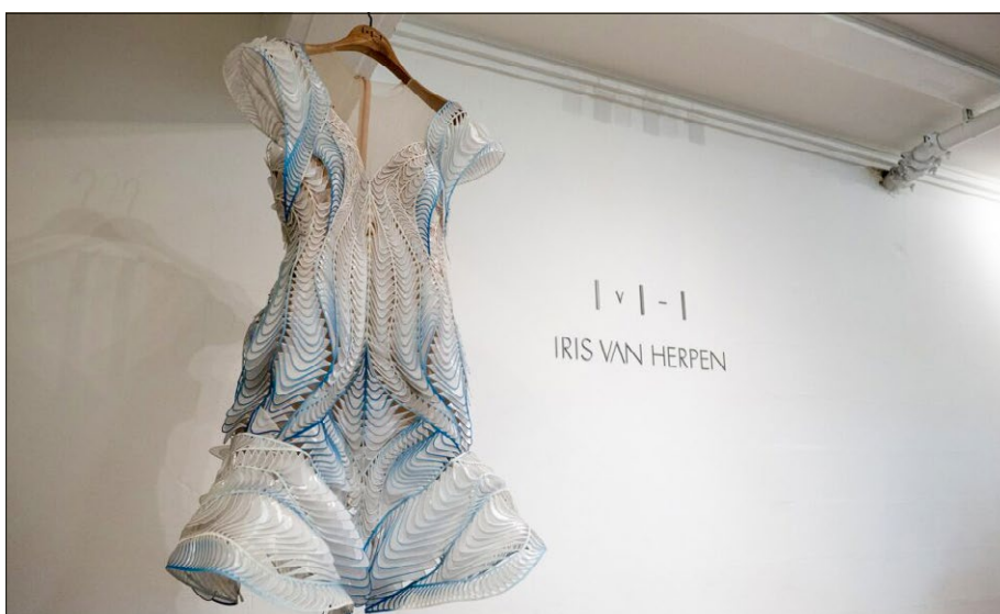
Als Grundmaterial für das Kleid wurden rezyklierte Evian-Flaschen verwendet. (Bild: Evian, Designer Iris Van Herpen, entwickelt Solaris Community)

Diese Pilotprojekte sind ein wichtiger Schritt in Richtung Kreislaufwirtschaft im Kunststoffsektor. Die hochwertigen Bauteile erlauben einen etwas anderen Blick auf das Kunststoffrecycling, welches sonst oft mit minderwertigen Produkten oder schwarzen Bauteilen assoziiert wird.