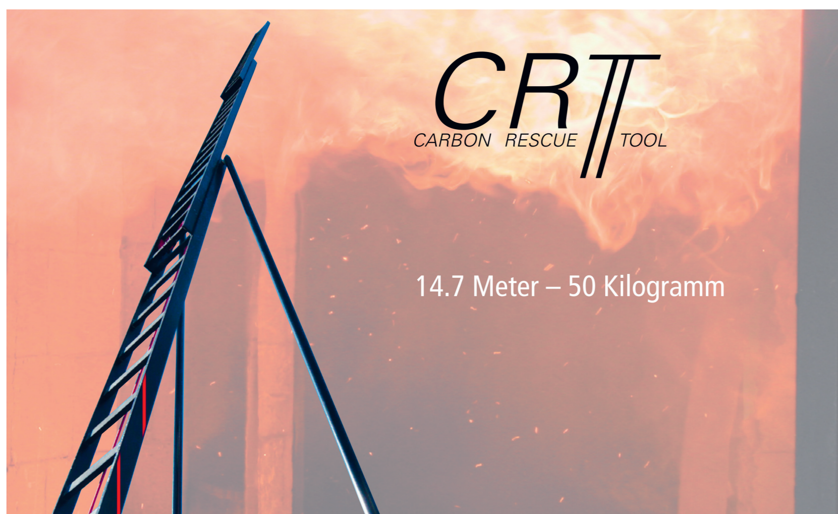
1 | Carbon Rescue Tool der aktuellen Generation