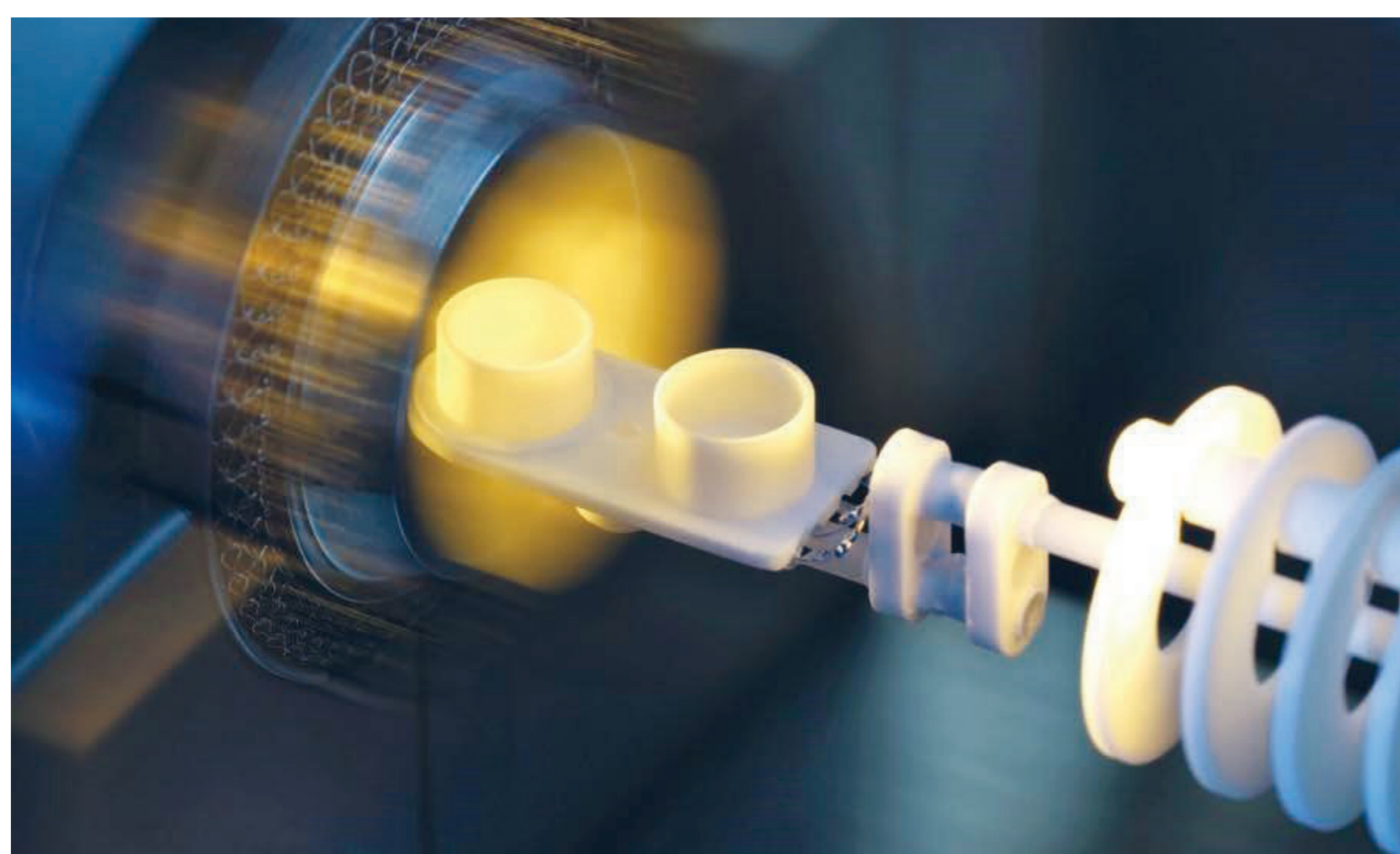
3 | Einblick in den TGA-Ofen und den Tiegelhalter mit Aluminiumoxid-Tiegel