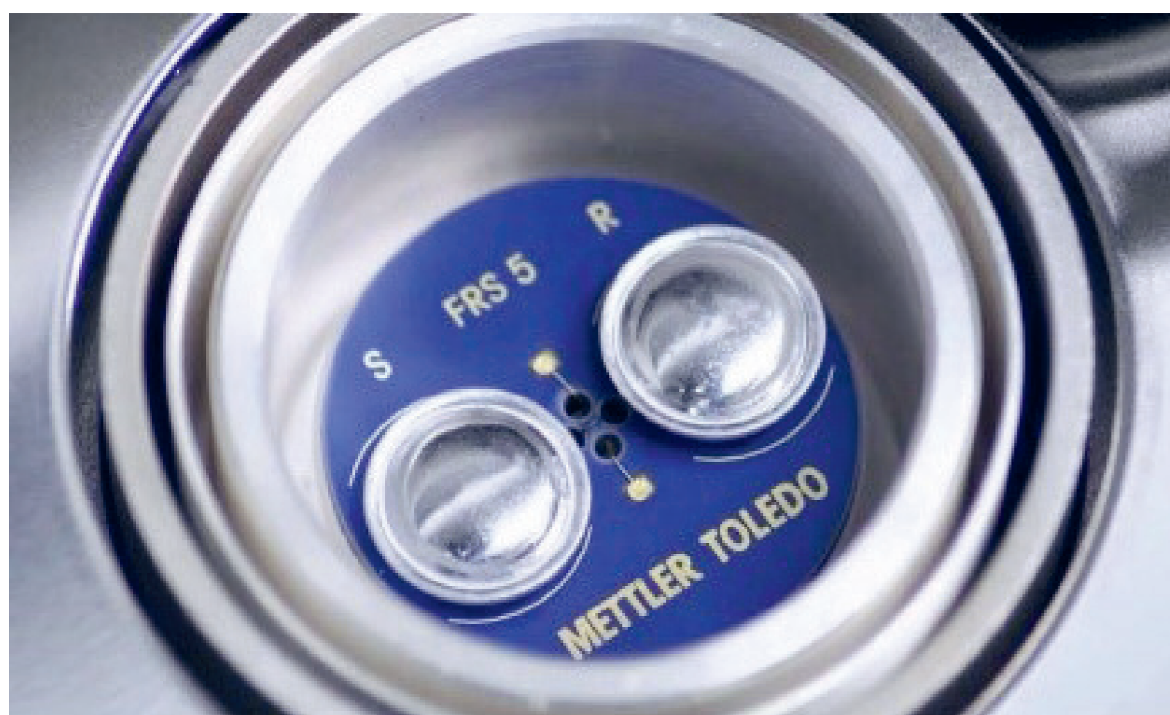
2 | Einblick in den DSC-Ofen: DSC-Sensor mit 2 Aluminium-Tiegel, R = leerer Tiegel (Referenz), S = Tiegel mit Probe (Sample)