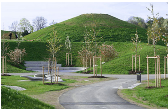
6'000 m 3 Speicher München-Ackermannbogen nach Fertigstellung