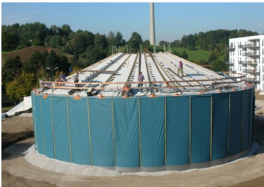
6'000 m 3 Speicher der Stadtwerke München GmbH in München-Ackermannbogen im Bau