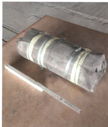
Aufgerollte und mit Draht umwickelte Bahn aus asbesthaltigem Bodenbelag («Asbestroulade»).