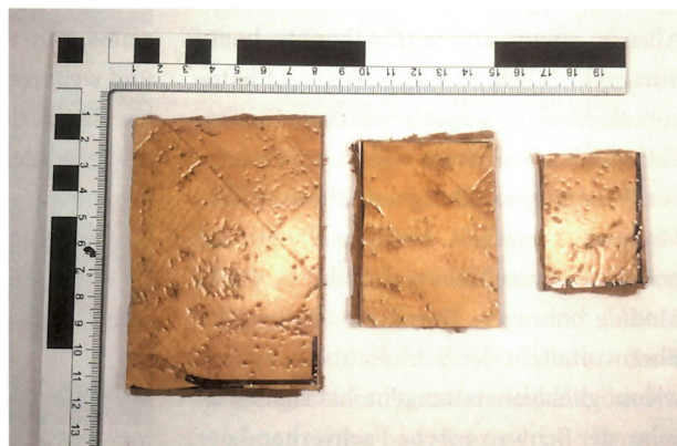
Versuchsmaterialien. Links Chrysotildichtschnur und rechts Cushion-Vinyl Boden.