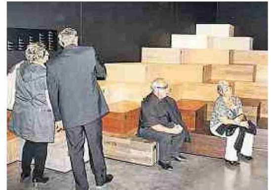
Lädt zum Sitzen und zum Philosophieren ein.