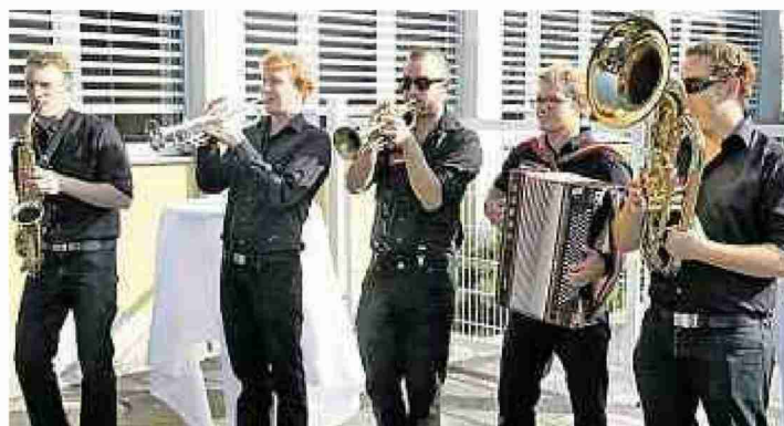
Viel Musik: Die Kriessener Fäschtbänkler mit fetzigen Klängen.