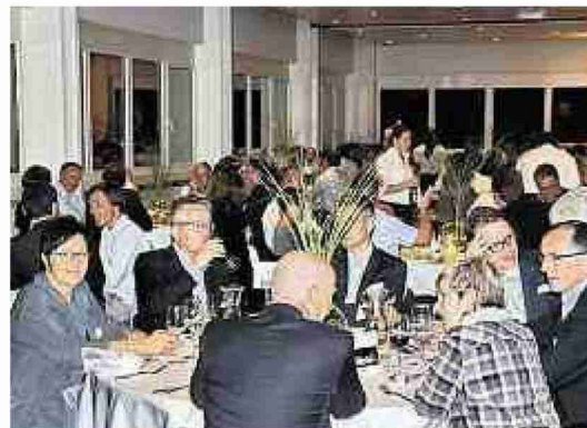
Festliches Gala-Diner im Schulungsraum.