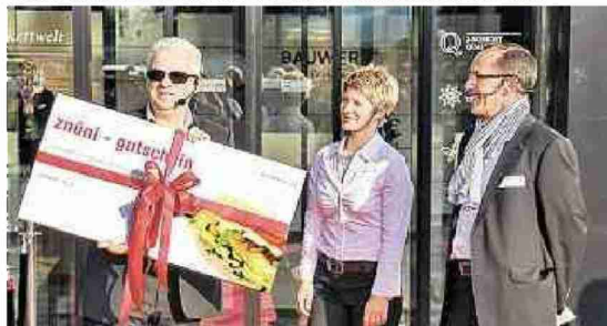
Ein tolles Geschenk der Architekten für die ganze Belegschaft.