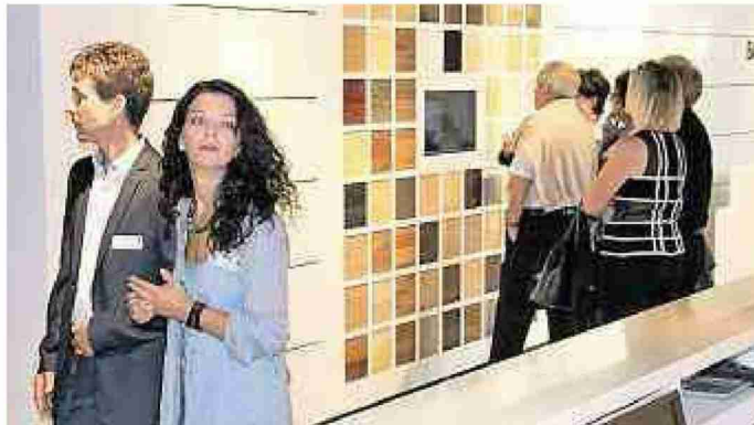
Heimeliges Holz in der hellen Halle anmächlich präsentiert.

Themen-Nr.: 375.5 Abo-Nr.: 375005 Seite: 49 Fläche: 96'727 mm 2