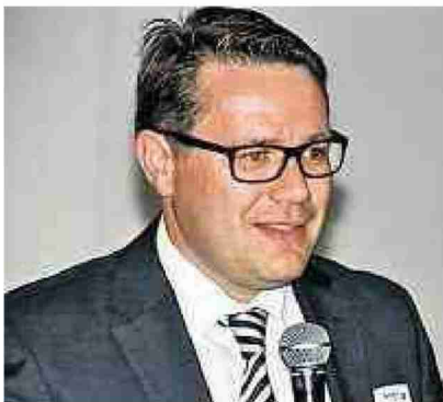
Überzeugt vom Standort: Regierungsrat Würth.