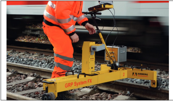
Abbildung 1: Gleismesswagen GRP System FX auf dem Gleis.

Einleitung: Im Bereich der Bahnvermessung bietet die Firma Amberg Technologies AG den modularen Gleismesswagen GRP System FX an (Abbildung 1). Mit diesem ist es möglich, verschiedene Gleisparameter, wie die Spurweite zu messen. Um eine möglichst effiziente Wartung der Gleise zu ermöglichen, muss die Position der Schwellen bekannt sein. Bis anhin hat Amberg Technologies AG kein Messsystem, um die Schwellenpositionen zu erkennen.