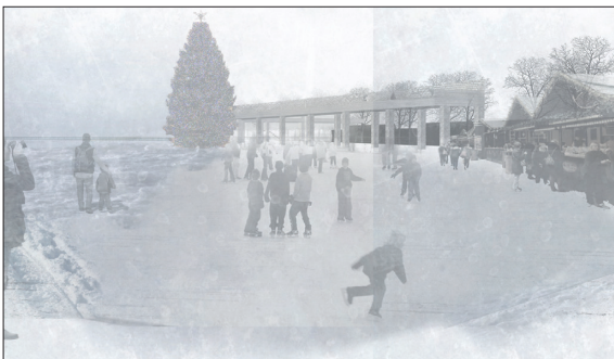
Visualisierung Platzsituation Winter

Ausgangslage: St. Moritz befindet sich in einer subalpinen Lage und stellt somit anspruchsvolle Anforderungen an Vegetation und Materialnutzung. Die Seepromenade bildet den Abschluss von St. Moritz Dorf, liegt direkt neben der stark befahrenen Hauptstrasse und ist eine der wenigen öffentlichen Freiflächen in St. Moritz. Die Gebäudestrukturen ziehen sich direkt bis an den See. Ein Problem stellt der Strassenlärm dar, da sich zwischen der Strasse und der Promenade nur wenige Meter Grün und Vegetation befindet. Die Landschaft rund um den St. Moritzersee weist zwei stark auffallende Gliederungen auf. Im Westen befindet sich die verbaute Landschaft von St. Moritz. Sie ist geprägt durch grosse Baublöcke, wenige öffentliche Flächen und terrassierte Geländeformen. Der östliche Teil des St. Moritzersee weist das extreme Gegenteil auf: eine naturnahe und unverbaute Waldlandschaft mit dem bekannten Bergpanorama St. Moritz.