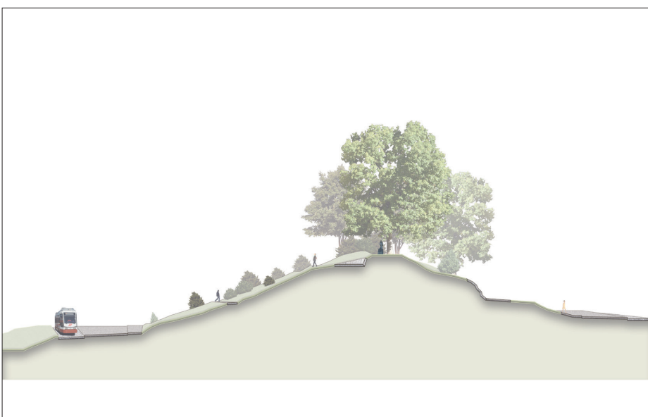
Vorprojekt – Schnittansicht

Die mit einheimischen Gehölzen überwachsenen naturnahen Teilbereiche auf beiden Seiten und der vegetationsarme, mit Terrassierungen gestaltete Mittelteil, sind schon von Weitem her sichtbar. Zwei von Speichers wichtigsten Wahrzeichen vereint an einem Ort. Dieser besitzt das Potenzial als Einheit, eine weitere wichtige Drehscheibe für das Dorf zu werden. Ob für Einwohner, Wanderer oder für Veranstaltungen, der neu entstandene Aufenthaltsbereich ist der optimale Ort für eine Vielzahl von Nutzungen.