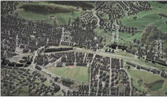
Abb. 1: Identitätsträger am Bahnkorridor

Ausgangslage: Viele Wege führen nach St. Gallen und dies auf eindruckliche Art und Weise. Wer mit der Bahn von Zürich oder Rapperswil anreist, überquert auf spektakulären Brücken die tiefe Schlucht der Sitter. Die letzten zwei Kilometer vor dem Erreichen des Hauptbahnhofs von St. Gallen sind hingegen atmosphärisch ernüchternd. Um St. Gallen zu einer imagestiftenden Stadteinfahrt zu verhelfen, wird in dieser Arbeit ein Konzept zur qualitativen Aufwertung des Bahnkorridors vorgestellt.