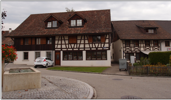
Abb. 1: Historischer Dorfkern Seens

Ziel der Arbeit: In dieser Projektarbeit wird eine Stadtteilentwicklungsstrategie für den Stadtkreis Seen in Winterthur entwickelt. Als erster Schritt wird eine Stadtteilanalyse mit den Schwerpunkten historische Entwicklung, Verkehrs-, Frei- und Grünraum-, sowie Bebauungsstruktur durchgeführt. Ausgehend von den Analyseergebnissen wird die Entwicklungsstrategie erarbeitet.