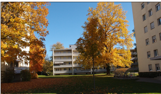
Abb. 2: Freiräume und moderne Bebauung

Weiter werden konkrete Entwicklungspotentiale thematisiert, insbesondere der Vorplatz des Bahnhofs Seen. Abschliessend werden mögliche Umsetzungsinstrumente und weiterzubearbeitende Schritte dargelegt. Diese Entwicklungsstrategie versucht sich nicht an utopischen städtebaulichen Entwürfen, sondern formuliert anhand fundierter Analysen realistische Handlungsempfehlungen für die sinnvolle Entwicklung des Stadtteils.