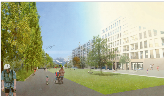
Visualisierung des Rösslimattparks