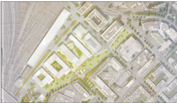
Plan der gestalteten Freiräume in der Rösslimattüberbauung: Güterplatz, Innenhöfe, Wohngassen und Rösslimattpark