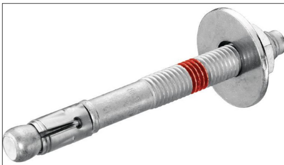
Metallspreizdübel HST3 der Firma Hilti AG

Einerseits sollen Unterschiede in den beiden Bemessungsdokumenten der SIA 179 von 1998 und 2018 aufgezeigt und deren Auswirkungen herausgearbeitet werden. Andererseits sollen in einer Gegenüberstellung von Tragsicherheitsnachweisen der aktuellen europäischen Bemessungsnormen und der künftig erscheinenden Norm SN EN 1992-4 für mechanische und chemische Dübel anhand von konkreten realen Anwendungen wirtschaftliche Folgen aufgezeigt werden.