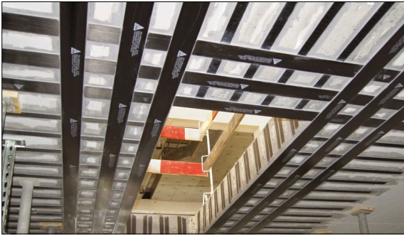
Verstärkung von Betonkonstruktionen anhand Sika CarboDur Lamellen www.bau.sika.com/de/kompetenzen/statische-verstaerkungen