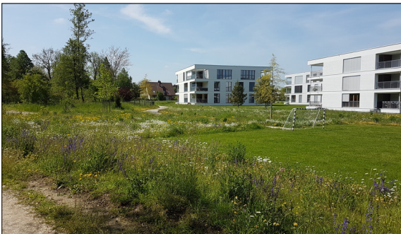
Multifunktionaler Siedlungsrand mit gewisser Vorbildfunktion. Eigene Darstellung