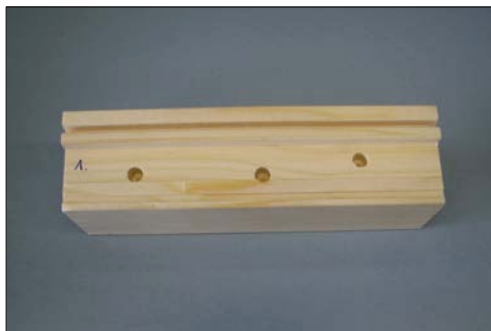
Rahmenprobe mit Montagebohrungen

Ausgangslage: Die 4B-Fenster AG ist spezialisiert auf die Herstellung von Schiebetüren sowie Neubau-, Renovations- und Designfenstern in Holz-Aluminium-Bauweise, jeweils den spezifischen Kundenwünschen entsprechend. Dies können Einzelanfertigungen bis hin zu Klein- oder Grossserien sein. Die Grösse kann von mehreren Dezimetern bis zu mehreren Metern variieren. Die 4B-Fenster AG möchte einen Teil der Fensterproduktion umstellen. Dabei werden zusätzliche Bohrungen benötigt, die später für die Montage der Beschläge wichtig sind. Auch möchte die 4B-Fenster AG eine neue durchgehende Grundier- und Lackierstrasse erstellen, damit das Umhängen der Rahmen nicht mehr nötig ist. Beim Bewässern der Grundierung bilden sich in den neuen Bohrungen Grundierdepots, die danach in aufwändiger Arbeit wieder gereinigt werden müssen. Die 4B-Fenster AG versucht zusammen mit der Firma Sattler Technologie & Innovation eine Lösung zu finden, um den Reinigungsprozess zu automatisieren.