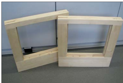
Fensterrahmen der 4B-Fenster AG mit den Bohrungen

Ausgangslage: Die 4B-Fenster AG ist spezialisiert auf die Herstellung von Schiebetüren sowie Neubau-, Renovations- und Designfenstern in Holz-Aluminium-Bauweise, jeweils den spezifischen Kundenwünschen entsprechend. Dies können Einzelanfertigungen bis hin zu Klein- oder Grossserien sein. Die Grösse kann von mehreren Dezimetern bis zu mehreren Metern variieren. Die 4B-Fenster AG möchte einen Teil der Fensterproduktion umstellen. Dabei werden zusätzliche Bohrungen benötigt, die später für die Montage der Beschläge wichtig sind. Auch möchte die 4B-Fenster AG eine neue durchgehende Grundier- und Lackierstrasse erstellen, damit das Umhängen der Rahmen nicht mehr nötig ist. Beim Bewässern der Grundierung bilden sich in den neuen Bohrungen Grundierdepots, die danach in aufwändiger Arbeit wieder gereinigt werden müssen. Die 4B-Fenster AG versucht zusammen mit der Firma Sattler Technologie & Innovation eine Lösung zu finden, um den Reinigungsprozess zu automatisieren.