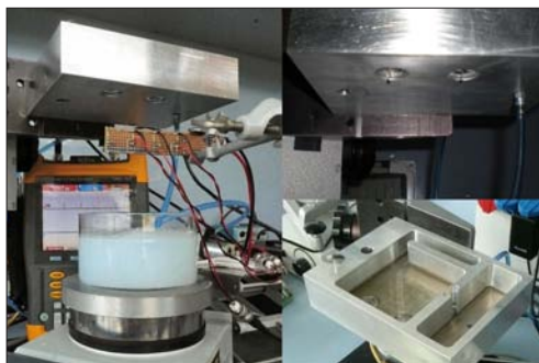
Messapparatur zur Bestimmung der Oberflächenspannung

Aufgabenstellung: Die schmutzlösende Wirkung von Waschmitteln basiert auf so genannten Tensiden. Aufgrund der oberflächenspannungssenkenden Wirkung der Tenside löst sich der Schmutz von der Wäsche. Die Adhäsionskräfte zwischen Schmutzpartikel und Oberfläche werden durch die Tenside reduziert. Die Oberflächen der gelösten Schmutzpartikel werden durch die Tenside besetzt und halten diese in Lösung. Sind sämtliche Oberflächen mit Tensiden belegt, beginnen diese zu so genannten Mizellen zu agglomerieren. Diese kritische Konzentration wird als CMC bezeichnet. Beim Erreichen der CMC ergibt eine Mehrzugabe von Waschmittel keine Steigerung der Waschleistung. Die CMC soll mit Hilfe einer Messung der Oberflächenspannung des Waschwassers ermittelt werden. Aufgrund der grossen Anzahl von Unbekannten beim automatischen Waschen (Verschmutzungsgrad der Wäsche, Härtegrad des Wassers, Temperatur, Zusammensetzung des Waschmittels etc.) wird selbst mit modernsten Waschmaschinen häufig überdosiert. Mit einer kontinuierlichen Oberflächenspannungsmessung während des Waschprozesses könnte dieser Überdosierung von Waschmittel Einhalt geboten werden und somit könnten jährlich beträchtliche Mengen an (umweltbelastendem) Waschmittel eingespart werden.