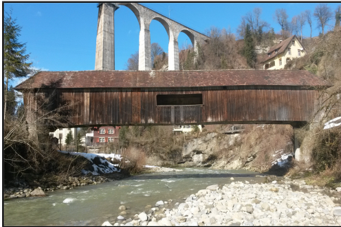
Oberwasserseitige Ansicht der Kubelbrücke (im Hintergrund ist das Sitterviadukt zu sehen)