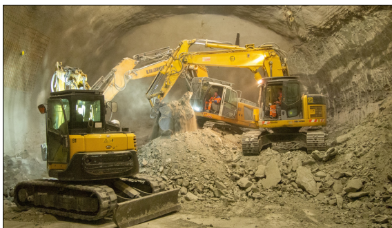
Ausbruch- und Schutterarbeiten erfolgen in der Kaverne auf engstem Raum

Ausgangslage: Das CERN, die Europäische Organisation für Kernforschung baut seinen grossen Teilchenbeschleuniger den Large Hadron Collider (LHC) aus. Nach dem Ausbau und der Inbetriebnahme des High Luminosity Large Hadron Collider (HL-LHC) im Jahr 2026 erhoffen sich die Forscher in einen neuen Bereich der Teilchenphysik vordringen zu können. Der Ausbau kostet rund 930 Millionen Schweizer Franken.