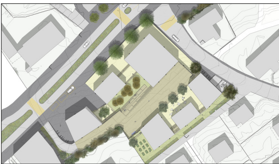
Ausschnitt Vorprojektplan Eigene Darstellung