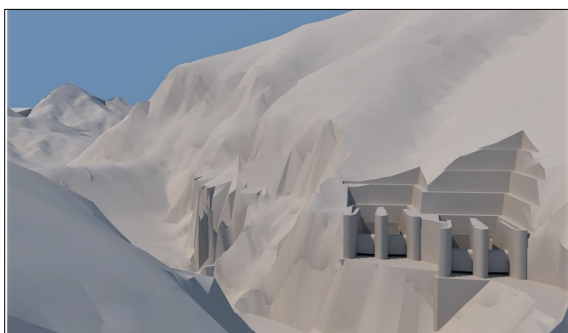
Animation Einleitbauwerk Endvariante Wehr mit Tunnel

Aufgabenstellung: 1988 wurde die Wasserkraftanlage Koman erbaut, welche mit den zwei weiteren Anlagen, Fierza und Vau-I-Dejes einen Kaskadenbetrieb bilden und 70% des Strombedarfs in Albanien decken. Die heutigen Sicherheitsanforderungen sind höher als diejenige, welche zur Zeit der Erbauung als Grundlage für die Dimensionierung der Hochwasserentlastung dienten. Die Kapazität der aktuellen Hochwasserentlastung, welche aus Tunnel 3 und Tunnel 4 besteht, ist ungenügend, weshalb ein Ausbau der Hochwasserentlastung überprüft werden soll.