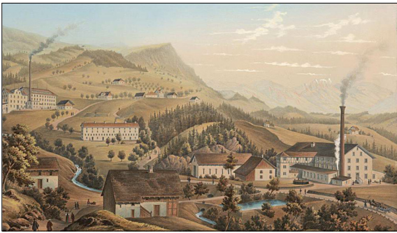
Spinnereien in Laupen bei Wald ZH (1872)

Ausgangslage: Das Zürcher Oberland war im 19. Jahrhundert eine der bedeutendsten Textilregionen Europas. Mit dieser langen und fortdauernden Geschichte hat die Industrielandschaft des Zürcher Oberlandes das Potential zu einem Identitätsträger zu werden und zum Regionalbewusstsein beizutragen. Mit der Förderung der Identifikation der Menschen mit der Region soll das Zürcher Oberland als attraktiver Lebens- und Wirtschaftsraum weiterentwickelt werden. Für diese Zielsetzungen wurde im Rahmen der Projektarbeit ein regionales Leitbild mit Entwicklungsvisionen erarbeitet.