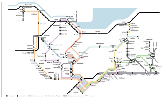
Linienetzplan Frauenfeld Nord Eigene Darstellung

Ausgangslage: Wie kann der Bus dem Auto die Stirn bieten? Das ist die Frage, die es in der Region Frauenfeld Nord zu klären gilt. Fehlende Anschlüsse, zu lange Reisezeiten: heute ist der ÖV keine gute Alternative. Am Bahnhof Frauenfeld ist ein Umstieg auf den Zug Richtung Weinfelden nicht möglich. Und um möglichst viele Gemeinden zu erschliessen, nimmt der Bus erhebliche Umwege in Kauf. Der öffentliche Verkehr spielt in der Region Frauenfeld deshalb eine untergeordnete Rolle. Auch der Halbstundentakt der Regionalbahnen und die Beschleunigung der Fernverkehrslinien auf Kantonsgebiet haben den Regionalverkehr in Frauenfeld Nord mit dem Fahrplanwechsel 2019 nur gering attraktiver gemacht.