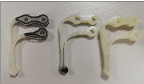
Verschiedene Varianten der Faserverbundwerkstoffbeine