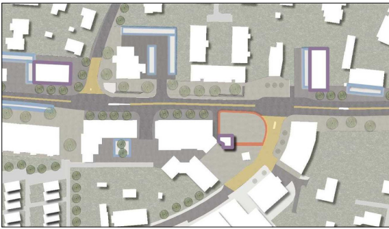
Neue Organisation der Hauptstrasse in der Dorfmitte: Vorplätze - Querungen - bequeme Trottoires Eigene Darstellung