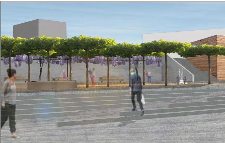
Blick von der Strasse auf den Dorfplatz

Ausgangslage: Ipsach ist ein Dorf im Verwaltungskreis Biel. Es ist es ein Straßendorf, da die Hauptverkehrsachse entlang des Sees gelegt und daran gebaut wurde. Somit wurde die Gemeinde in zwei Teile zerschnitten. Beide weisen ihre Vorteile, Schwächen und Potenziale auf. Die Dorfmitte ist durch das hohe Verkehrsaufkommen kaum erlebbar, außerdem fehlt ein prägender Dorfplatz.