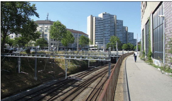
Der Seebahn-Einschnitt mit dem Hochhaus Lochergut Eigene Darstellung