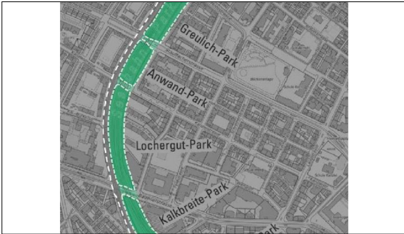
Der Seebahn-Einschnitt besteht aus sechs Teilflächen hochparterre