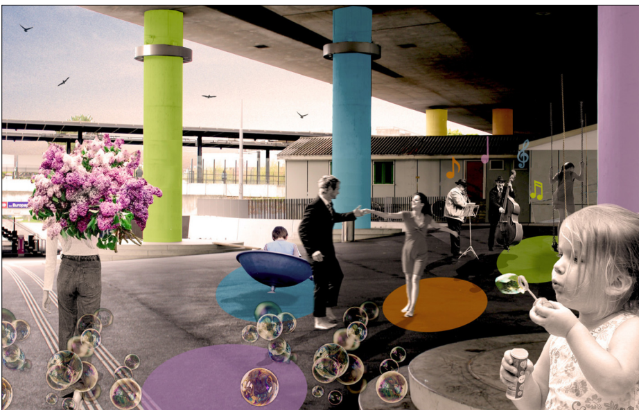
Der farbenfrohe Platz im Herzen von Europa (Atmosphärenszene)

Ergebnis: Das Resultat ist eine Analyse ausgewählter Szenen entlang des Spazierganges im Untersuchungsraum, welcher die vielfältige atmosphärische Identität des Ortes aufdeckt. Durch Skizzen und Text werden die Szenen und dessen Atmosphäre dargelegt. Das Medium Film soll Lesern der Arbeit ermöglichen in kürzester Zeit und ohne grossen Aufwand, selbst zum Betrachter bzw. zum erforschenden Spaziergänger von Ausserholligen zu werden. In Atmosphärenszenen werden Darstellungen für das Zukunftsprogramm des Ortes angefertigt. Die atmosphärischen Vorher- Nachher Bilder zeigen die potentiale des Ortes auf.