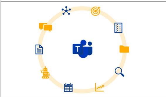
Zusammenarbeit mit MS Teams firstattribute.com