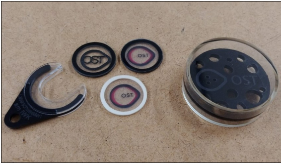
Erstellte Produkte Münzenhalterung mit 3 Münzenvarianten / Geduldspiel Eigene Darstellung