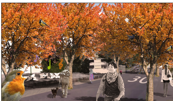
Vision: Die Stöckackerstrasse ist ein Ort der Begegnung.

Einleitung: Die Arbeit untersucht die Ästhetik des Raumes, um in diesem zu entwerfen. Es wird festgehalten und wiedergegeben, wie der Beobachter durch die Landschaft wandert. Der zu entwerfende Raum ist der Entwicklungsschwerpunkt Ausserholigen. Er bietet eines der grössten Entwicklungs- und Flächenpotenziale in der Stadt und der Agglomeration Bern.