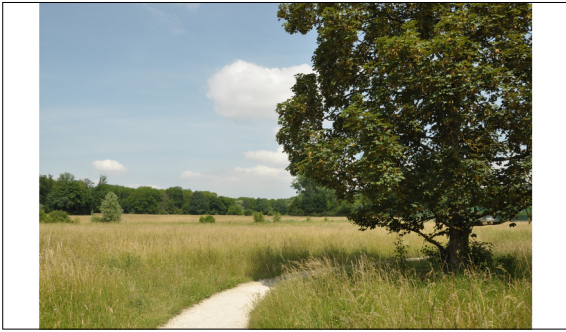
Landschaftliche Weite im Landschaftspark Wiese

Ausgangslage: Der Landschaftspark Wiese ist ein etwa 600 ha grosser, unbebauter Landschaftsraum in der Agglomeration Basel-Stadt. Er ist ein unverzichtbarer Naherholungsraum für die angrenzende Bevölkerung und gleichzeitig der wichtigste Trinkwassergewinnungsstandort für Basel, Riehen und Weil am Rhein. Trotz seines Namens ist der Landschaftspark in der heutigen Wahrnehmung vielmehr eine Kulturlandschaft mit Erholungsinfrastrukturen. Aufgrund seiner teilweise unklaren Randbereiche und Eingängen fehlt die Wahrnehmung als zusammenhängender Gesamttraum.