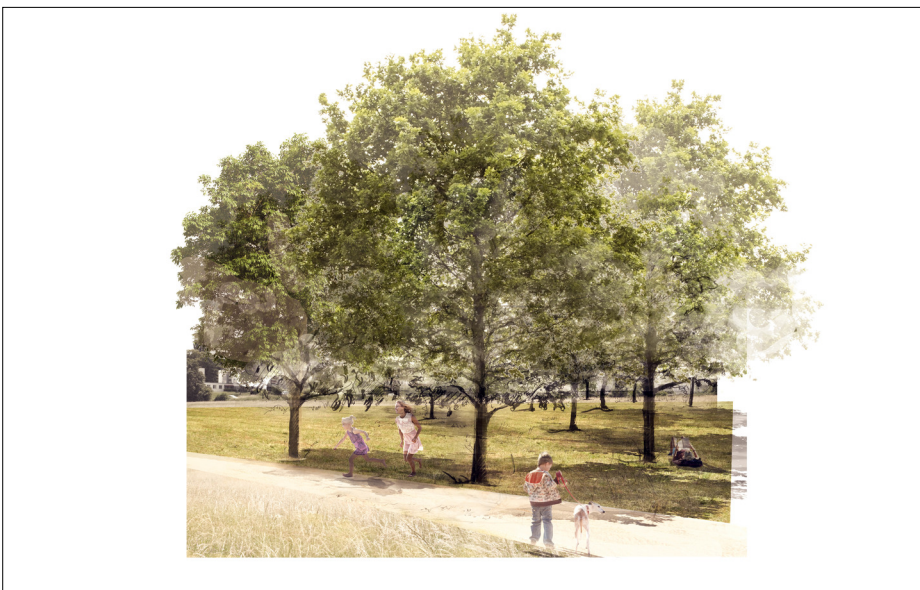
Der Nussbaum und Eichenhain an der Allmend bei Riehen

Ergebnis: Ein Parkband hält als Rahmen die unterschiedlichen Fragmente und Typologien an den Parkrändern zusammen. Das Parkband übernimmt eine Scharnierfunktion zwischen Siedlungsgebiet und dem inneren Park und definiert den Randbereich des Landschaftsparks mit unterschiedlichen Gehölztypologien. Siedlungsnah und infrastrukturgebundene, intensive Erholungsnutzungen sind in diesem Band angegliedert, die punktuell ergänzt werden durch Nutzungsangebote, die die Bevölkerung stärker einbinden und Raum für Entfaltung und Aneignung lassen. Der innere, grösstenteils extensiv genutzte Park wird durch das Parkband mit angrenzendem Randweg klar ablesbar. Die Interventionen passen sich den jeweiligen örtlichen Begebenheiten unaufdringlich an und schaffen somit einen Ortsbezug und stärken die räumlichen Eigenheiten.