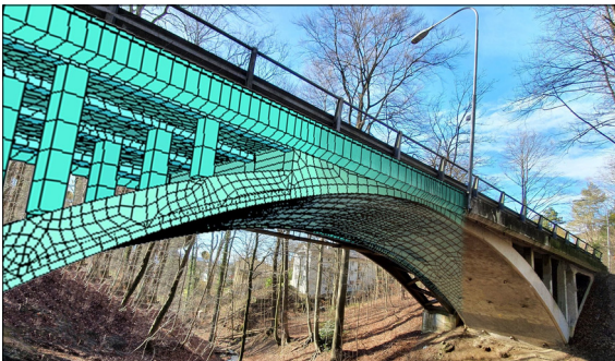
Brücke über Wolfbach in Blickrichtung Nordwest, links als SOFiStiK-Berechnungsmodell Eigene Darstellung

Vorgehen: Die Daten aus der Zustandserfassung von 2019 wurden mit aktuellen normativen Grundlagen ausgewertet, um den Bauwerkszustand zu beurteilen. Vorrangig wurden die aktualisierten Baustoffkennwerte, der Korrosionszustand der Bewehrung sowie die Korrosionsindikatoren ermittelt. Weiter wurden die vorliegenden Bauwerksakten studiert und die wesentlichen Erkenntnisse zusammengetragen. In einem weiteren Schritt erfolgte die statische Überprüfung, wobei das Lastmodell 1 nach SIA 269/1 als Grundlage diente. Statisch stark beanspruchte Stellen wurden aufgezeigt und mögliche Verstärkungsmassnahmen erarbeitet.