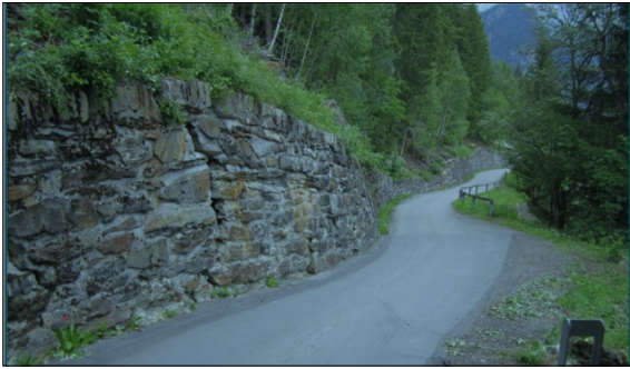
Setzung der Strasse und Schaden an der bestehenden Stützkonstruktion

Ausgangslage: Die ganze westliche Talflanke zwischen San Carlo und Poschiavo ist versackt und gliedert sich in verschiedene und unterschiedlich aktive Rutschschollen. Der stark deformierte Strassenabschnitt Capitul liegt innerhalb des genannten Blockschuttfeldes. Das in der Falllinie langgestreckte Blockschuttfeld verschiebt sich zusammen mit der Rutschung Capitul mit einer Geschwindigkeit von 20 - 100 mm/Jahr talwärts