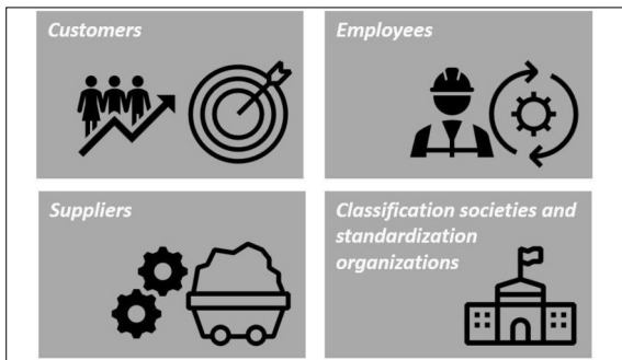
Die wichtigsten Anspruchsgruppen an PLM-Landschaften. Eigene Darstellung