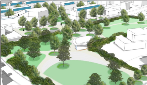
Neuer grosszügiger Park