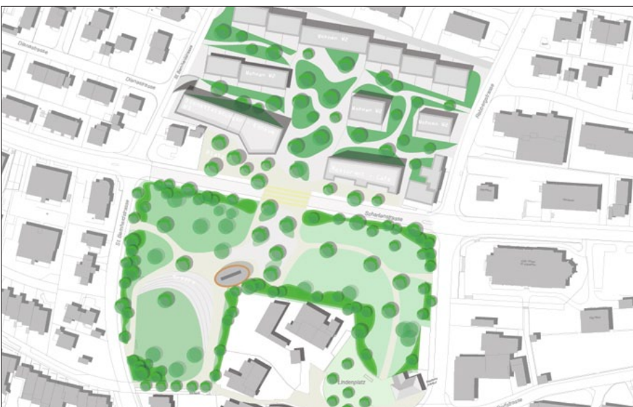
Übersicht auf Park und Siedlung

Ergebnis: Auf dem Gebiet der heutigen Gärtnerei soll anhand eines Gestaltungsplanes eine höhere Dichte erzielt werden. Die neue Bebauung soll sich in die bestehende Quartierstruktur eingliedern und eine direkte Anbindung zum neuen Park erhalten. Die neue Siedlung wird autofrei gestaltet, sodass Bewohner und Besucher eine ruhigere Umgebung geniessen können. Es soll ein Dialog zwischen dem Park und der neuen Siedlung entstehen. Durch eine differenzierte Raumfolge soll der Park vielfältige Nutzungen anbieten und ein aktives Naherholungsgebiet werden.