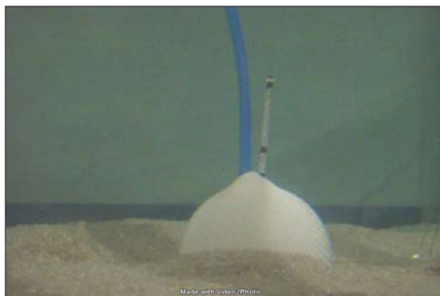
Muschel für Trajektorienerfassung

Einleitung: An der Universität Zürich wurde das Projekt «Muschelroboter» ins Leben gerufen. Durch Versuche mit verschiedenen Muschelformen soll einerseits die Grabeffizienz untersucht werden und sollen andererseits Rückschlüsse auf die Evolution sowie zu den Zusammenhängen zwischen Morphologie und Grabverhalten dieser Tiere gezogen werden. Dieses Projekt wird vom Schweizerischen Nationalfonds zur Förderung der wissenschaftlichen Forschung unterstützt.