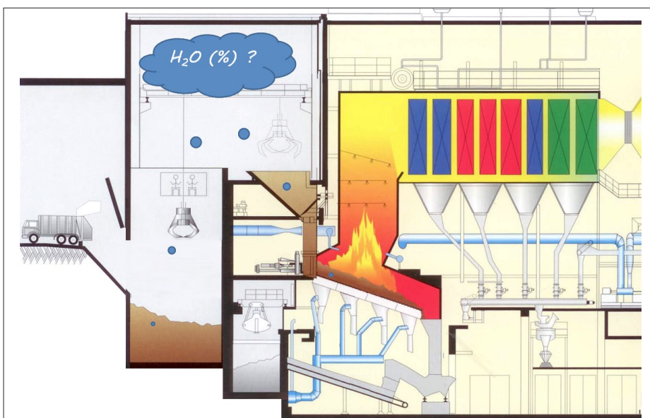
Feuchtigkeitsmessung in KVA, schematische Darstellung der KVA Buchs SG