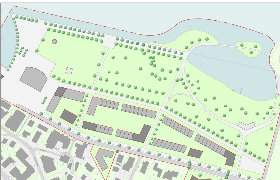
Ausschnitt Bebauungskonzept See-Areal Lachen SZ

Ergebnis: Das See-Areal soll auch weiterhin wichtige Freizeit- und Erholungsfunktionen beinhalten. So soll entlang des Seeufers eine durchgehende Freifläche entstehen, welche zum aktiven, aber auch ruhigen Verweilen einlädt. Die frei werdenden Flächen am Rand des Dorfkerns werden für die Realisierung eines Kulturzentrums am See genutzt und entlang der Seestrasse zur Erstellung von attraktivem Wohnraum für eine breite Bevölkerungsschicht. Auf diese Weise werden die begrenzten Landreserven der Gemeinde effizient genutzt, wodurch auch dem demografischen Prozess der Überalterung entgegengewirkt wird.