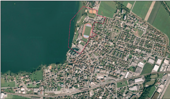
Perimeter See-Areal Lachen SZ

Ausgangslage: Für das bisher für Schul- und Sportanlagen genutzte See-Areal in Lachen SZ ist für den Zeitraum nach der Verlegung dieser Einrichtungen an andere Standorte ein Entwicklungskonzept zu erarbeiten. Dieses baut auf Erkenntnissen der vorangegangenen Planung «Lachen Vision 2030» auf und hat Angaben über Bebauung, Erschliessung, Nutzung und Freiräume zu beinhalten. Es werden auch Aussagen zu möglichen Realisierungswegen durch raumplanerische Mittel und Instrumente getroffen. Das See-Areal befindet sich nördlich des historischen Dorfkerns am See. Es ist ein wichtiges Naherholungs- und Freizeitgebiet und weist eine hohe Standortqualität auf.