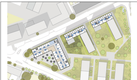
Vertiefung: Heim für Senior*innen Amt für Raumentwicklung Zürich, online & Eigendarstellung

Ausgangslage: In den nächsten Jahren wird die Bevölkerungsgrösse in der Stadt Zürich stark zunehmen. Da in der Stadt kaum mehr unbebautes Bauland vorhanden ist, lautet die Devise: Verdichten. Grosses Potenzial sieht die Stadt diesbezüglich hauptsächlich in den Stadtrandgebieten. Ein solches Gebiet bildet auch Schwamendingen.