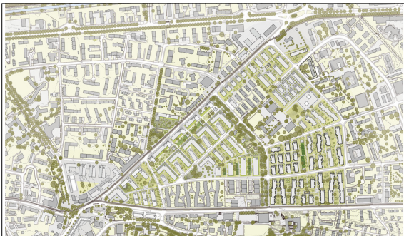
Situationsplan Amt für Raumentwicklung Zürich, online & Eigendarstellung