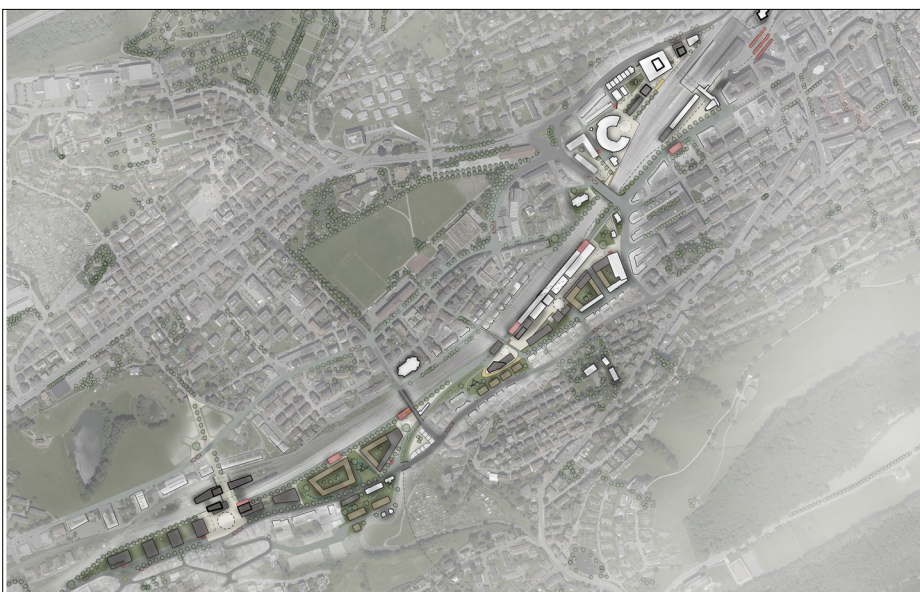
Abb. 3: Gesamtplan der räumlichen Vision