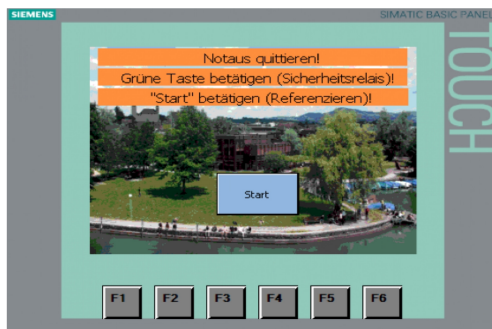
Startbild des Touchpanels mit Hinweisen für den Bediener

Ergebnis: Das Ergebnis der Semesterarbeit ist das funktionsfähige Modell eines Hochregallagers. Es gibt dem späteren Besucher einen Einblick in die Technik und die Arbeiten an der HSR. Sämtliche Abläufe sind in der SPS umgesetzt und durch das bedienerfreundliche Touchpanel abrufbar. Durch mechanische Anpassungen, ist die Anlage stabiler geworden und lässt sich problemlos transportieren. Das Zuführ- und Auslagerungssystem ist betriebsfähig. Durch die Entnahmebox aus Plexiglas kann die Entnahme durch Sensoren überwacht werden und schützt so den Bediener vor ungewollten Eingriffen in die Anlage. Für die vollautomatische Identifizierung der Paletten wurde ein RFID-System entworfen.