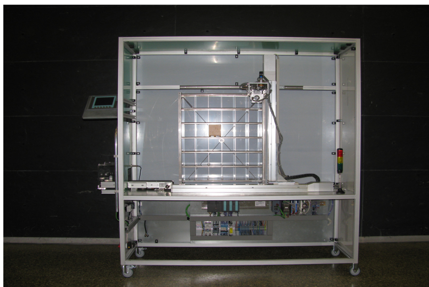
Gesamtansicht der Anlage