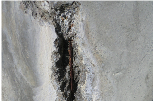
Tiefreichender Stahlbetonschaden an der undichten Wand des Wasserreservoirs im unteren Bereich des Rundbaus