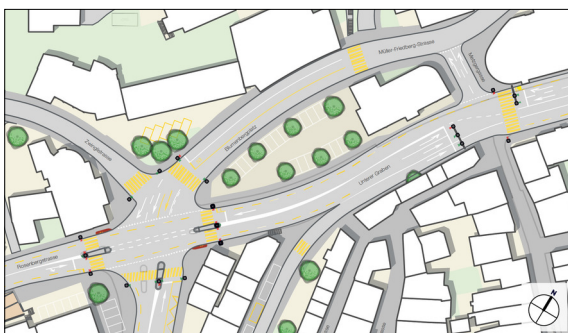
Abb. 3: Ausschnitt Schlüsselstelle Blumenbergplatz

Vorgehen: Durch das Studium der Planungsgrundlagen wurde klar ersichtlich, dass die Stadt St.Gallen das Verkehrswachstum über den öffentlichen Verkehr sowie Fuss- und Veloverkehr bewältigen will. Zudem zeigte die Analyse der einzelnen Verkehrsmittel auf, wo der Handlungsbedarf liegt. Aus diesen Erkenntnissen wurden Ziele zur verkehrlichen Entlastung der Innenstadt definiert. Anschliessend wurden im Variantenstudium vier Ansätze einer möglichen Verkehrsführung geprüft und anhand geeigneter Kriterien bewertet. Die Variante „Autoarmes Zentrum Plus“ schnitt bei der Bewertung am besten ab und wurde daher zur weiteren Ausarbeitung des Gesamtverkehrskonzepts bestimmt. Die Bestvariante konnte bei der Entlastung des Zentrums überzeugen, ohne dabei die bestehende Durchfahrtsachse Rosenbergstrasse zu überbelasten.