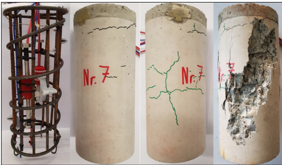
Prüfkörper 7 (li.: Aufbau, mitte: Schwindrisse nach 40d und nach Temperaturversuch, re.: Abplatzungen nach Bruchversuch)

Einleitung: In Bauteilen aus Beton entstehen aus verschiedenen Gründen Spannungen, welche eine Stauchung oder Ausdehnung der Bauteile zur Folge haben. U. a. folgende Einflussfaktoren bestimmen die Dehnungen in Betonbauteilen: